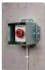
SCG1EE monterad runt SCB3DL